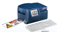
GlobalMark ® Color & Cut