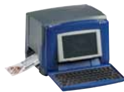
BBP™31 SIGN & LABEL PRINTER

Wenden Sie sich an Ihren lokalen Technischen Support: www.bradyeurope.com/services