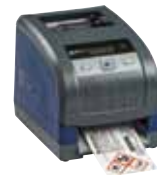
BBP™33 LABEL PRINTER